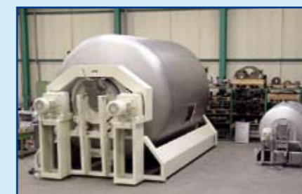
Lindor menger en laboratorium-uitvoering ondergaan eindtest.

De ogen van Soeteman gaan glinsteren als hij over de menger van Lindor praat. "Onze menger heeft unieke eigenschappen voor het snel en zorgvuldig mengen van kwetsbare producten. Er is geen roerwerk dus de Lindor menger verbruikt slechts 1/5 tot 1/10 van de energie van mengers met roerwerk. Lindor is goed in het mengen van kwetsbare producten zoals thee en in het opbrengen van vloeistoffen, zoals smaakstoffen. Maar ook instantpoeders voor bijvoorbeeld koffie of soep, droge soepen en sauzen met gedroogde groenten en vermicelli zijn geschikte producten. De menger wordt veel gebruikt voor het mengen van 'breakfast cereals' en babyvoeding, een moeilijk te mengen product. Waar allergenen een rol spelen, is het een voordeel dat de Lindor menger goed is schoon te maken." Een heel andere toepassing is het mengen van metaalzouten en metaalpoeders, waaronder batterijpoeders voor accu's in mobieltjes en laptops. In de chemie worden de mengers ingezet voor producten die snel of veel stof veroorzaken of die bijvoorbeeld explosief zijn, zoals de vaste raketbrandstof voor de Ariane raketten. "Sommige klanten gebruiken onze menger als draaiend reactorvat waarbij droge producten met vloeistoffen onder het mengen een verbinding aangaan. Lindor